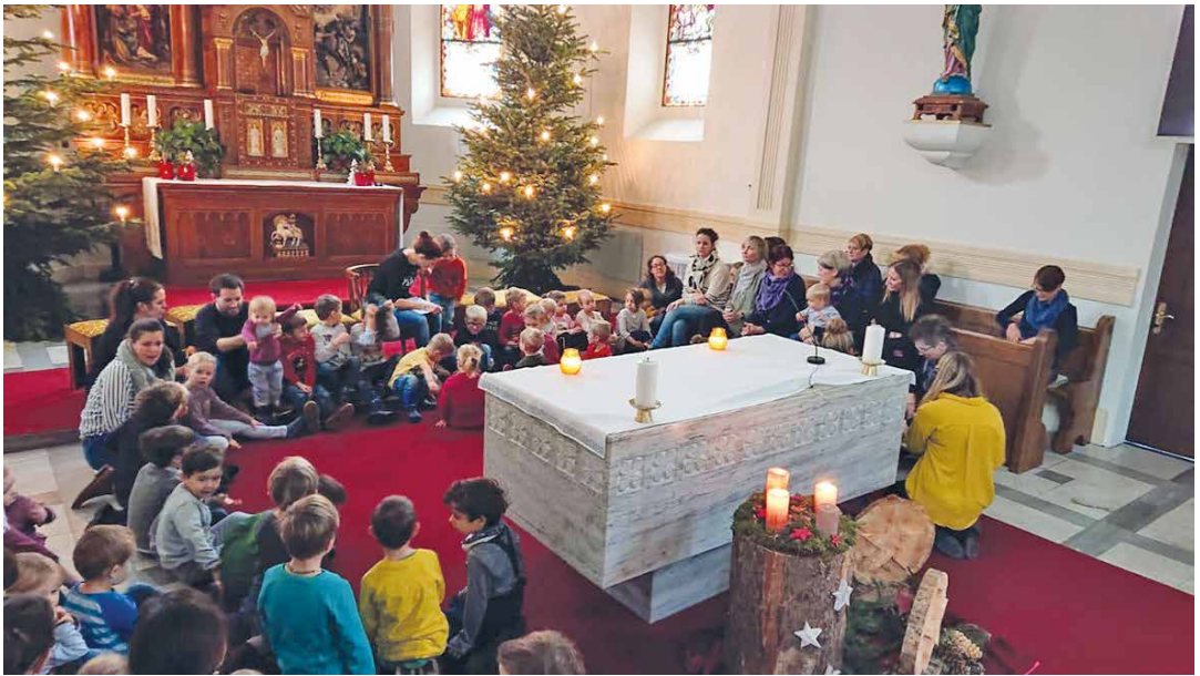
Adventsfeier für die kleinen Kinder am 19. Dezember.