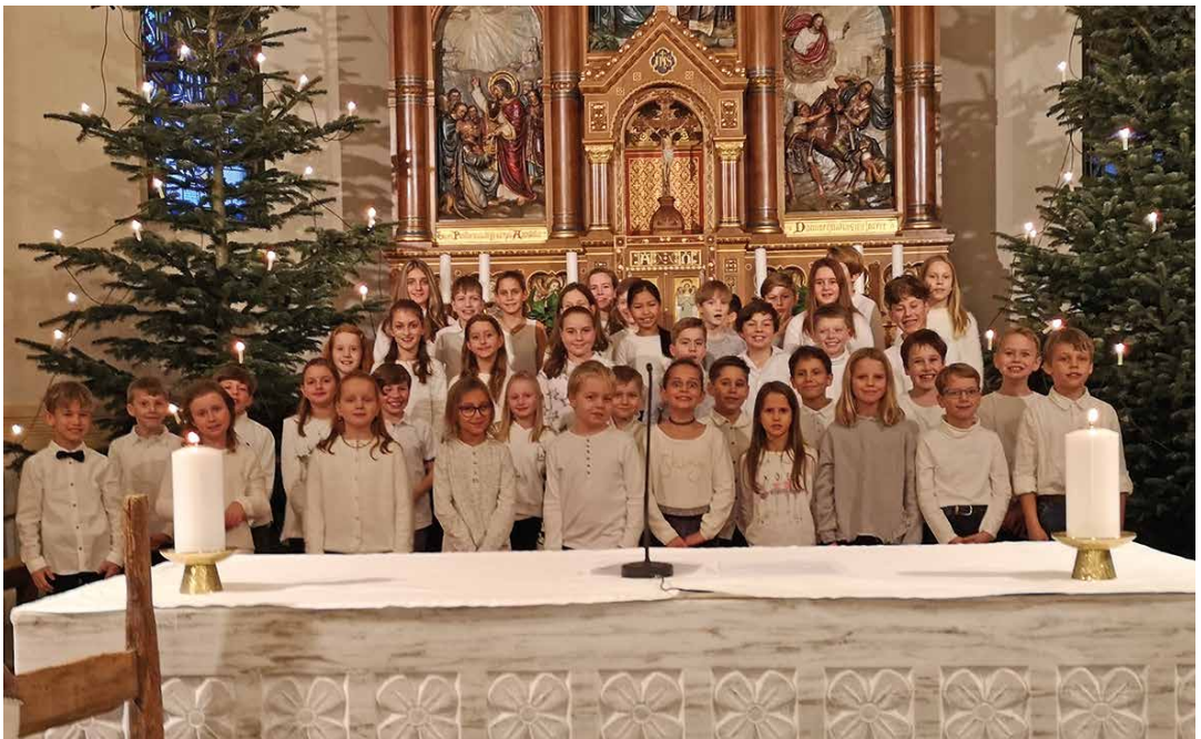
Wortgottesdienstfeier für Kinder und Familien am Heiligen Abend.